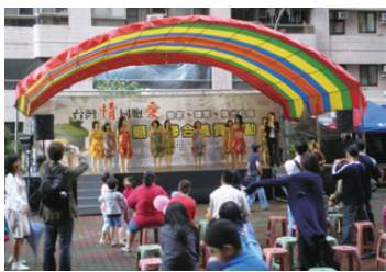
精彩熱鬧的表演活動

當時，國內正遭遇莫拉克颱風肆虐、重創南台灣，影響地區滿目瘡痍、怵目驚心。三社區參與之委員及住戶們，皆歷經89年的象神颱風及90年的納莉颱風淹水之苦。本著人飢己飢、人溺己溺之信念，決定凝聚社區力量，共同發起賑災義賣活動，並決定將義賣所得全部捐贈賑災。活動當日邀請社區住戶進行各項才藝表演：包括樂器演奏、肚皮舞、運動舞演出、兒童美語歌唱、相聲、讀經班、太極拳表演等，現場熱鬧非凡。本次活動共有17個跳蚤市場攤位，並募集近百件義賣商品。另有21名住戶參與西點製作，並將全數西點作為當日義賣之用。而這次活動共計捐出43,780元給受災嚴重的台灣兒童暨家庭扶助基金會高雄縣分事務所。