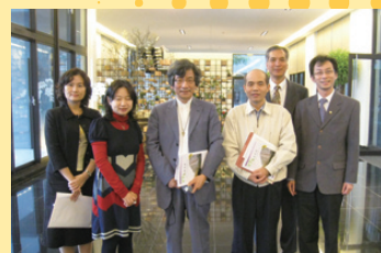
「忠泰風格」陳副主委(左二)親自接待

本次參訪，感謝「忠泰風格」社區陳副主委全程以流利的日語親自接待導覽，不但讓折田會長留下深刻印象，也讓東京都公司順利協助主管機關完成參訪任務。