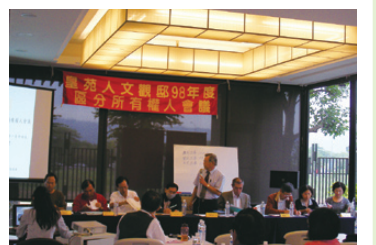
社區召開區分所有權人大會

餐會籌備工作繁瑣費時，稍有不慎，全盤皆沒，每個環節皆不能有差錯，否則亂象立見。感謝委員們熱心參與及指導，現場同仁全力配合與協助，才能讓本次餐會圓滿順利。此次餐會活動賓主盡歡，讓享用者皆留下深刻印象。