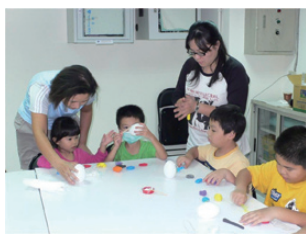
「再興春天」社區住戶專心製作成品