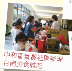
中和富貴賞社區辦理台南美食試吃