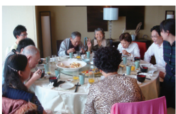
住戶享用美味的中餐

接下來繼續前往富基漁港參觀及購買海產，最後一站則來到淡水欣賞出名的夕陽美景，各住戶在淡水老街盡情地吃、喝、玩、樂，不管大人、小朋友都玩的很开心、意猶未盡。直至晚上7點大家才帶著一顆依依不捨的心揮別這趟秋季之旅，踏上回家的旅途。