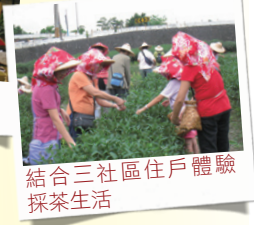
結合三社區住戶體驗採茶生活