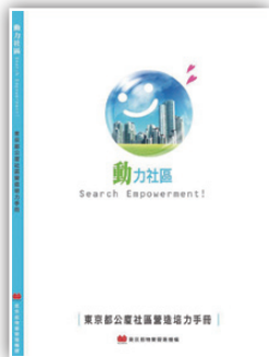
東京都公廈社區營造培力手冊

總編輯：林錫勳 編輯顧問：謝文雀 執行編輯：魏雅蘭 編輯群：陳月玲、王嘉珊、陳卉蓁、倪美雪、劉美伶、劉靜蓮、何沛薰、朱詩婷、汪瑋琳、朱孔麟