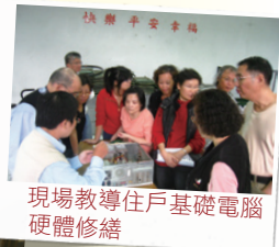
現場教導住戶基礎電腦硬體修繕

未來東京都亦將與聯盟進行更緊密的合作，透過政府及聯盟力量，結合各種資源舉辦精彩活動，提供社區知性、愉悅的生活學習機會，讓住戶享受更豐富的生活服務。