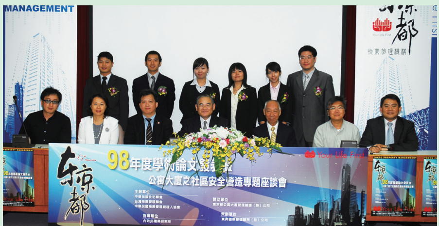
植野董事長、林資深副總經理與得獎學生、評審老師、指導教授等合影