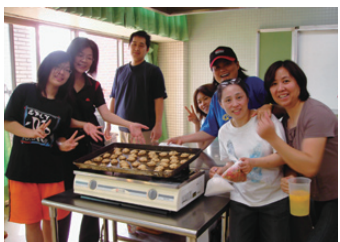
住戶參與西點教學，並將成品捐做義賣

結束不是一個句點；本活動辦理不僅落實了公部門政策，並增強社區自主能力，減少社會問題；對於物管公司而言，不再只是具備「樓管」、「清潔」、「機電」、「保全」的功能，而是具備更多資源整合的能力成就專業管理人正面的形象；對社區而言，皇家天下、國泰環翠天廈F區、陽光天廈三個社區的住戶產生良好互動、並擁有了美好的共同記憶。社區代表們更期待明年度可連結本地區的其他社區擴大辦理活動。