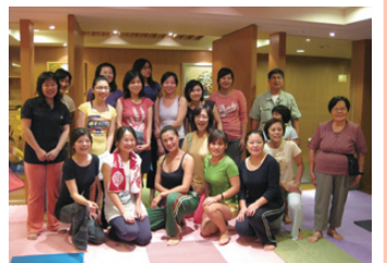
社區住戶與老師合影

俠隱社區很順利的在11月開班，成功的為新竹地區社區活動帶來不同的風貌。接下來我們也將陸續推展一連串的社區活動，期望能為新竹地區的社區提供更多元的服務。