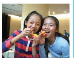
「世界山莊」社區開心製作彩繪蛋的小朋友

本次活動共吸引約40位小朋友及家長共同參與。大家利用輕塑土來做造型，小朋友可以發揮巧思及無限的想像力，創造出各式各樣的作品，而陪同的家長也樂在其中。小朋友所完成的作品個個都令人驚豔，讓平常緊張忙碌的生活加入許多樂趣，在場的每個人都玩得非常開心。