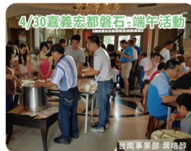
4/30嘉義宏都磐石-端午活動