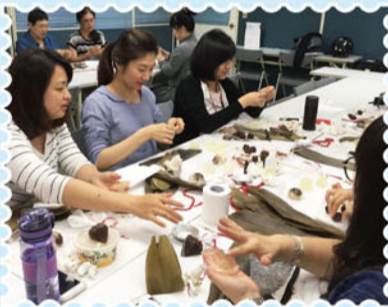
▲仔細的將餡包入Q彈的外皮