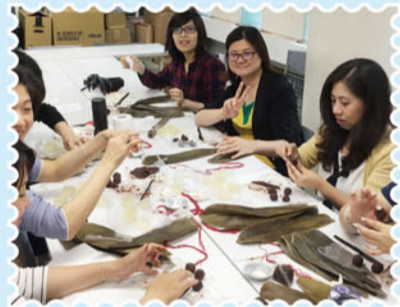
▲大家聞著紅豆餡的香氣一邊將餡塑型

下午1點聘請專業師資來指導同仁包「冰晶粽」，已備好清洗好的粽葉，粽子的Q彈外皮與蜜香紅豆餡等分裝好的食材，老師耐心指導，搭以簡單的步驟，讓所有人輕鬆上手，完成的成品一串串水晶粽，各個精緻漂亮，味道也相當可口，整場活動於下午2點半順利結束。