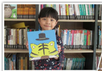
▲小朋友完成後開心與作品合影

最後，一幅幅可愛的動物油畫經過孩子們的巧手順利完成，家長和小朋友意猶未盡，整場活動於近中午圓滿結束。