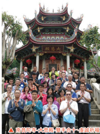
▲南普陀寺-大悲殿-雙手合十-虔誠祈福

抵達金門後，一行人轉乘「新五緣號」前往廈門，第一個行程為廈門必訪南普陀寺，透過導遊解說，了解這座廟宇興建於唐朝，主祭「觀音」，已有近千年的歷史，於閩南地區有相當的重要性。緊接著參觀存有十九世紀最大海岸炮的胡里山砲台。當日最後行程則是參觀清末民初華僑領袖陳嘉庚先生陵園-龍園。