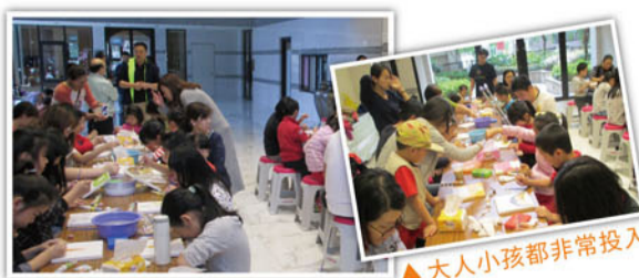
▲社區不分老少都拿起畫筆著色