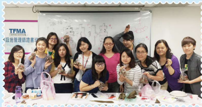
▲參加包粽同仁與自己的精心傑作合影