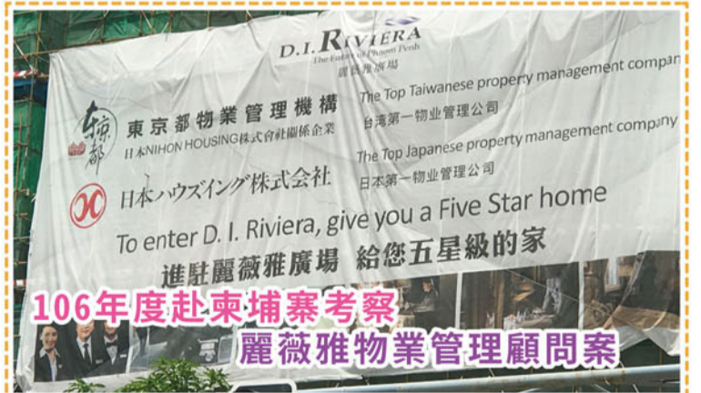
營運中心 蔡嘉芳 經理