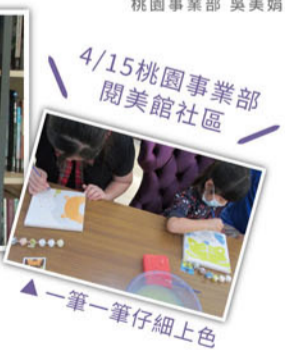
▲一筆一筆仔細上色