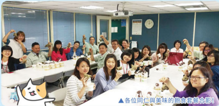
▲各位同仁與美味的飽食套餐合影!

5/26(五)總公司職福會舉辦了端午節活動，分別有粽子飽食套餐與包水晶粽的體驗活動。上午11點半餐點於3樓會議室準備就緒，12點鐘響時同仁陸續進場領取，每人一份肉粽、碗糕及魚丸湯套組，食物樣式豐富且份量充足，讓各位同仁一同歡度端午佳節。