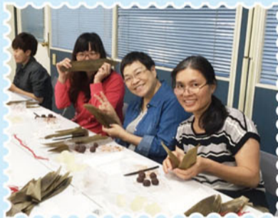
▲再用粽葉包住就大功告成囉!