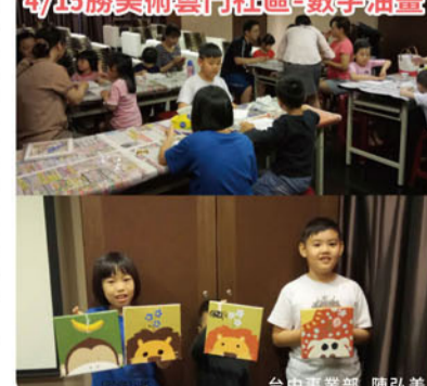
4/15勝美術雲門社區-數字油畫