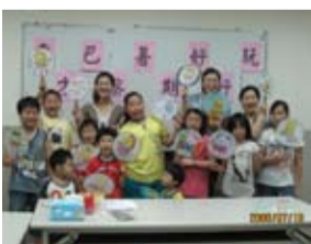
東方巴黎社區彩繪扇會後歡喜留影

位於汐止的東方巴黎社區，自7月18日起舉辦「暑期好好玩」系列活動，供社區住戶報名參與。第一堂課為彩繪扇製作，孩子們將自己手上的扇子塗上他們喜愛的花樣，成為獨一無二的彩繪扇；第二堂課捏製彩繪蛋，透過雙手捏出創意十足的蛋型。透過自己的創意製作，繪扇、繪蛋的課程讓孩子們好有成就感；最後一堂課則為四方牧場廠商至社區教導住戶製作營養好吃的奶昔，今年的暑期活動讓老舊不常使用的社區會議室重新活用，並為社區注入柔性的元素，住戶間互相聯誼，增進彼此間的情誼。