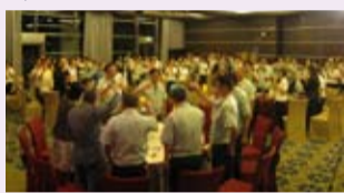
全體舉杯同慶15週年