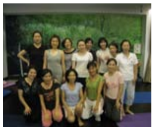
快樂學瑜珈的社區住戶

本次的體驗頗受住戶好評，很順利的於28日正式開課。藉著活動的辦理，不但可活絡社區公設使用率，還可以促進住戶間之情誼，提昇社區生活品質；每位住戶對於可在社區輕鬆學習，又可兼顧上述原因，都感到非常滿意。