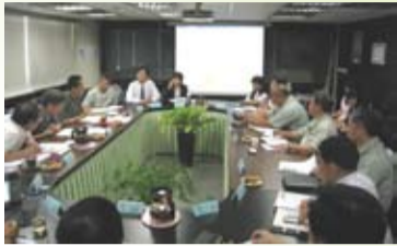
聯合型教育訓練執行成果訪查

自94年起，東京都每年配合行政院勞委會職訓局為協助企業人力資源提升，辦理聯合型教育訓練，本聯訓單位結合東京都旗下五家公司及策略廠商巨人資訊共同辦理「聯合型」訓練，以提升服務品質與競爭力。本年度規劃之計畫為【提昇物業管理優質服務】。以「強弱勢」為思考中心的三大訴求，希望能朝此方向前進。