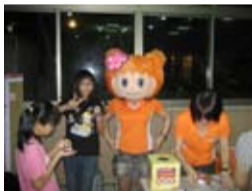
可愛又青春活潑的EASY小姑娘

本次活動共吸引社區內老中青三代女性住戶約40餘人參與，盛況可謂空前。每名參加的住戶也都獲得奧黛莉公司免費贈送的精美禮物及優惠券。現場更舉辦有獎徵答活動，帶動了全場的歡樂高潮，在一片歡樂氣氛中，活動劃下完美句點。