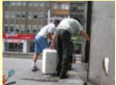
八八水災26個社區獻愛心，募集160箱物資至屏東

為協助受災同胞重建生活，東京都與康福搬家公司合作，於8月21日發起社區物資捐助計畫。鎖定重建所需物資包括「電器商品」及「鍋碗瓢盆」，以具體行動協助居民儘速安頓生活。感謝26個社區參與本次活動：大都市新天地、師大禮居、大安麗水、中南海別墅、藝術陽明、甲大直、冠德美麗大湖、天母真園B座、潤泰極品、日安台北、極景藍區、中央臻寶、捷和創世紀、太平洋時代、中正國寶、名人錄、南北大、潤泰東昇、樂樹園、台北光點、民權雅居、溫哥華、雅曼尼CASA、東方晶華、米蘭花園廣場1期、米蘭花園廣場2期社區。此次共募集160箱的物資，由康福搬家於9月1日送抵屏東災區，並由屏東市公所人員簽收完成。