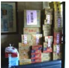
博愛童黨大廈募集之物資

而位於左營的聖第二代社區，則發起每戶捐款及捐衣物的方式，陪伴南部受難的同胞一起度過難關。