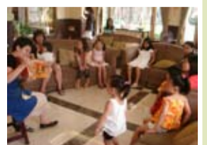
瑞林珍寶社區媽媽說英文故事，培養孩子的英文能力