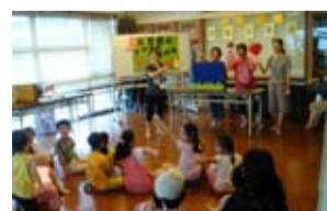
文德國小袋鼠媽媽表演團體於正隆麗池社區與小朋友互動遊戲

本活動希望走出圖書館，將故事帶進社區，與民眾分享閱讀的樂趣，喚起民眾對閱讀的興趣，培養習慣，使閱讀成為生活的一部份。也期望能有更多的志工加入故事媽媽的行列，一同說故事給大家聽。