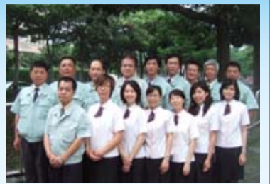
台中分公司工作同仁

今年9月份東京都與佳茂建設合作，進駐「世紀之頂」及「世界之心」。此豪宅將突破傳統管理方式，營造同業間無法模仿之差異性，勢必對台中樓管界投入一震憾彈，也將成為台中公司的代表性案場，為東京都開啟新契機。