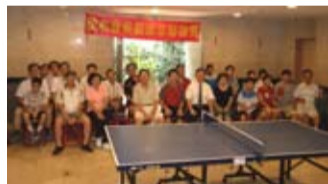
聯誼賽前快樂的合影

最後由主任委員頒獎予各組優勝者，參賽者衣服上的汗水和微笑的臉孔為這場活動劃下美麗的句點。