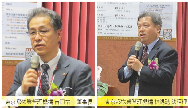
東京都物業管理機構 吉田裕幸 董事長