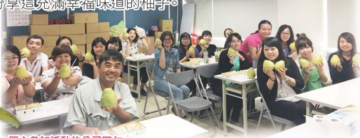
開心參加活動的公司同仁

這天，從未停止的歡笑聲與清新香甜的果香交織成美妙的秋季交響曲，縈繞在東京都會議室裡久久不散。活動結束後，同仁們開心的拎著自己做好的成品以及所發送的柚子，期待回家後與家人一同分享這充滿幸福味道的柚子。