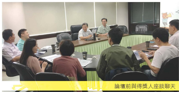
論壇前與得獎人座談聊天

東京都物業管理機構於10/18(三)假臺灣大學圖書館國際會議廳舉辦「106年度台灣物業管理趨勢論壇」。物業管理趨勢論壇邁入第14年，今年再以「高齡化社會的物業管理服務新趨勢」為主題，由中國科技大學何明錦教授主持，與產官學研共同探討相關因應對策。