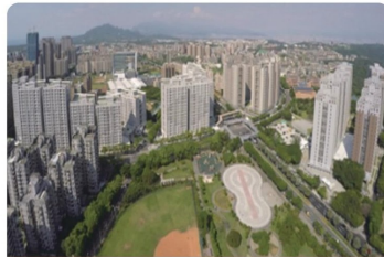
林口世大運 選手村社會住宅