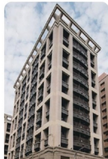
三重 青年社會住宅