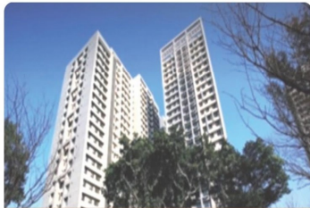
板橋浮洲 合宜住宅

東京都物管機構及關係企業京陽物管公司，至今受託經管的公共住宅包括國家住宅及都市更新中心的林口世大運選手村社會住宅；新北市的板橋浮洲合宜住宅、三重青年社會住宅、中和青年社會住宅等；台北市的興隆D1區公共住宅暨文德、港墘站、龍山寺站、小碧潭站、臺北橋站公共住宅戶等；台中市的大里正社會住宅；原民會的花東新村；公共住宅經管戶數已逾萬戶，未來將以累積經管公共住宅的專業經驗，拓展公共住宅物業管理的市場，以擴大公司經管物業類型的範疇。此外，社會住宅的包租代管業務，為政府鼓勵民間釋出閒置資產出租的專案，自2018年實施為期三年的社會住宅包租代管試辦計畫，公司亦已取得社會住宅包租代管廠商資格，並於今年度啟動包租代管業務，全面開拓公營住宅的物業管理及賃租管理市場，以推動公司經營的長期發展。