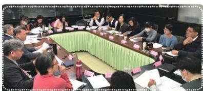
▲第一季勞資會議暨勞工安全管理會議