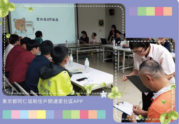
東京都同仁協助住戶開通愛社區APP