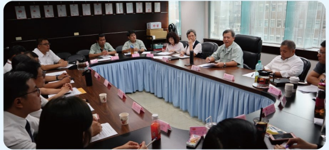
東京都保全、東京都公寓、東京都環保、眾鼎工程各派代表於東京都總公司參與勞資會議

108年6月27日，公司依法召開東京都保全、東京都公寓、東京都環保、眾鼎工程年度第二次勞資會議。會中宣佈今年度員工安全健康檢查規劃案，並針對大法官釋字748號同性婚姻合法化、即將施行之勞動事件法加以說明，讓同仁皆能對新的法律有基礎概念。同時也再次宣導部門需落實出勤管考、預防性騷擾和性平法。同日召開聯合勞工安全衛生管理會議，宣導保障勞工安全與健康之目的所做的各項管理事項。