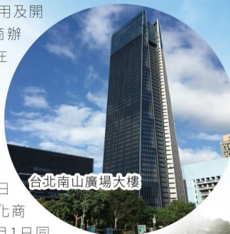
台北南山廣場大樓

東京都繼去年4月1日進駐台北南山廣場大樓，今年7月1日進駐遠雄金融中心。為持續強化商辦業務開發動能，公司也於7月1日同步於營推中心下設商管小組，負責A級商辦物件之開拓及管理。