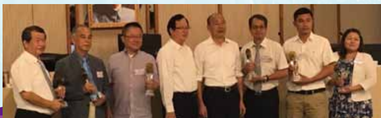
高雄市優良公寓大廈雄勇組社區代表合照(左1「河隄之心」、右1「藝術大街」)