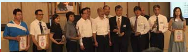
高雄市優良公寓大廈雄青組社區代表合照(右2「美術君臨」、右4「百達儷緻」)