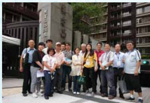
評鑑委員與「東方晶典」社區代表合照