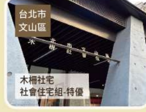
臺北市 文山區 木柵社宅 社會住宅組-特優