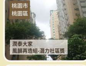
桃園市 桃園區 潤泰大家 風韻再造組-潛力社區獎