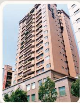
臺北市 大安區 師大禮居 零碳標竿獎 典範獎