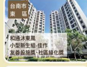
臺南市 東區 和通沐東風 小型新進組-佳作 友善設施獎-社區綠化獎