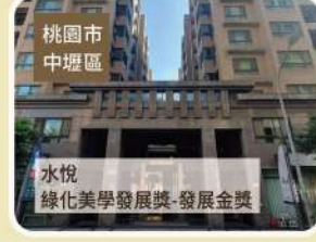
桃園市 中壢區 水悅 綠化美學發展獎-發展金獎