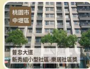
桃園市 中壢區 普忠大道 新秀組小型社區-樂居社區獎