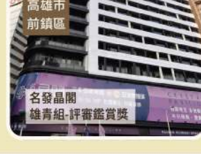
高雄市 前鎮區 名發晶閣 雄青組-評審鑑賞獎