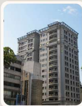
臺北市 中正區 臨沂帝國 零碳標竿獎 優等