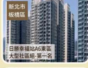
新北市 板橋區 日勝幸福站A6東區 大型社區組-第一名