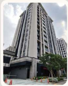
新北市 土城區 馥華城安 低碳社區 銀鵝獎