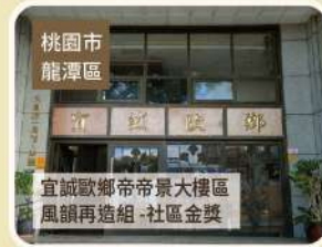
桃園市 龍潭區 宜誠歐鄉帝景大樓區 風韻再造組-社區金獎