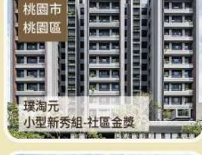
桃園市 桃園區 環淘元 小型新秀組-社區金獎