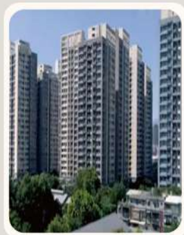
新北市 板橋區 日勝幸福站A6東區 低碳社區 白金級標章認證 無菸標章