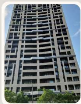
新北市 新莊區 亞昕向上 低碳社區 銀鵝獎