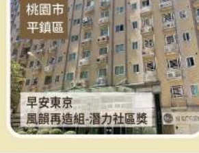
桃園市 平鎮區 早安東京 風韻再造組-潛力社區獎