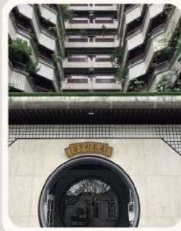
臺北市 信義區 翠亨村名廈 零碳標竿獎 優等