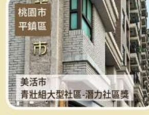
桃園市 平鎮區 美活市 青壯組大型社區-潛力社區獎