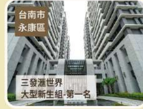
臺南市 永康區 三發滙世界 大型新進組-第一名