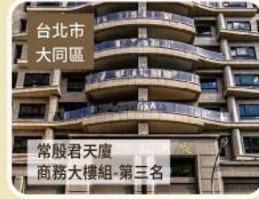
臺北市 大同區 常殷君天廈 商務大樓組-第三名