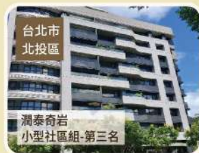
臺北市 北投區 潤泰奇岩 小型社區組-第三名