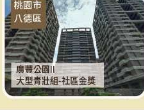
桃園市 八德區 廣豐公園II 大型青壯組-社區金獎