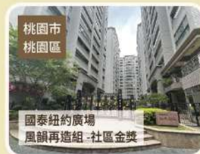
桃園市 桃園區 國泰紐約廣場 風韻再造組-社區金獎