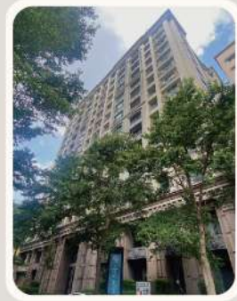
新北市 永和區 芬第夏宮 低碳社區 銀鵝獎