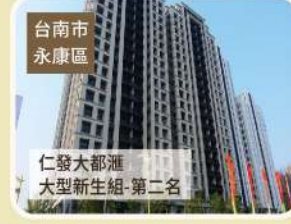
臺南市 永康區 仁發大都匯 大型新進組-第二名