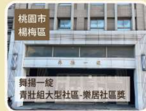
桃園市 楊梅區 舞揚一旋 青壯組大型社區-樂居社區獎